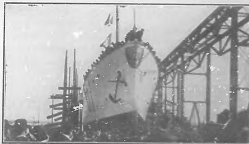
El buque escuela "Patria" minutos antes de deslizarse sobre las aguas del río Delaware.