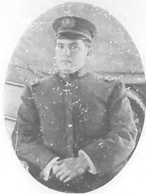
Comandante Díaz Quiñes

¿Cómo se puede hablar de actos semejantes, cuando la emoción nos privó en aquellas horas inolvidables, en aquellos minutos de intensa ventura, del lenguaje de los labios para que hablara á nosotros mismos el lenguaje expresivo del corazón?